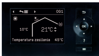
Wyświetlacz regulatora Vitotronic 200 (typ WO1C)

VITOCAL 200-G solanka / woda: 5,8 do 17,4 kW woda / woda: 7,5 do 22,6 kW