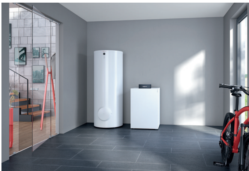
Pompa ciepła Vitocal 200-G z pojemnościowym podgrzewaczem c.w.u. Vitocell 100-W (z lewej)

Vitocal 200-G posiada certyfikat KEYMARK